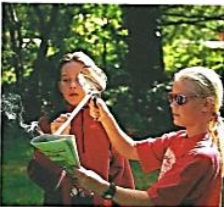
3 Die Energie des Lichts kann Gegenstände entzünden.

Zerstreuungslinsen sind in der Mitte dünner als am Rand. Sie zerstreuen parallel einfallende Lichtstrahlen. Zerstreuungslinsen haben einen virtuellen Brennpunkt.