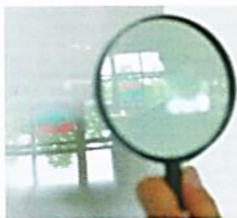
3 Zu Versuch 1

Mit den drei Hauptstrahlen lässt sich das Bild eines Gegenstands konstruieren.