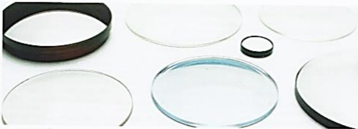
2 Optische Linsen

zerstreuten Lichtstrahlen hinter der Linse in Gedanken zurück verlängerst, dann treffen sich auch diese Linien in einem Punkt. Da dieser Punkt durch die gedachten Linien entsteht, heißt er virtueller Brennpunkt (scheinbarer Brennpunkt).