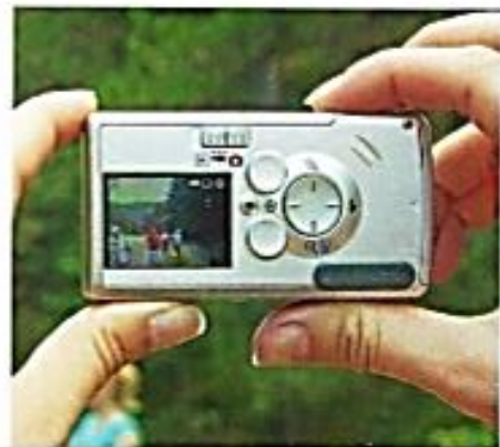
2 Sammellinsen im Fotoapparat erzeugen ein Bild.

Nach dem Durchgang durch die Sammellinse schneiden sich die drei Hauptstrahlen in einem Punkt. An dieser Stelle befindet